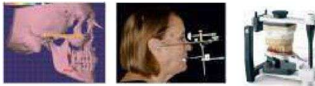
CURRENT ASSEMBLING VA - DIGITAL WORKFLOW